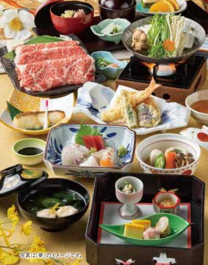
写真は「華」のイメージです。