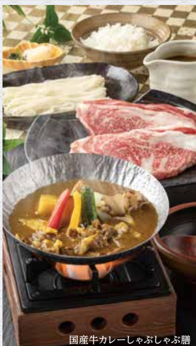
国産牛カレーしゃぶしゃぶ膳