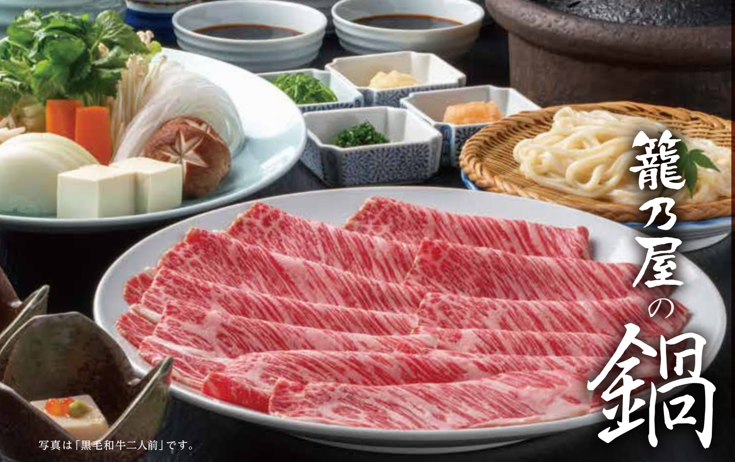
写真は「黒毛和牛二人前」です。