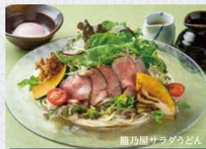
龍乃屋サラダうどん

岐阜県内で育てられた 黒毛和牛。きめ細かく、 柔らかい肉質、編み目の ような霜降りと芳醇な 味わいが特徴の全国有数 のブランド和牛です。