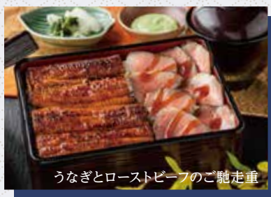
うなぎとローストビーフのご馳走重