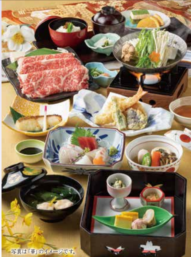
写真は「華」のイメージです。