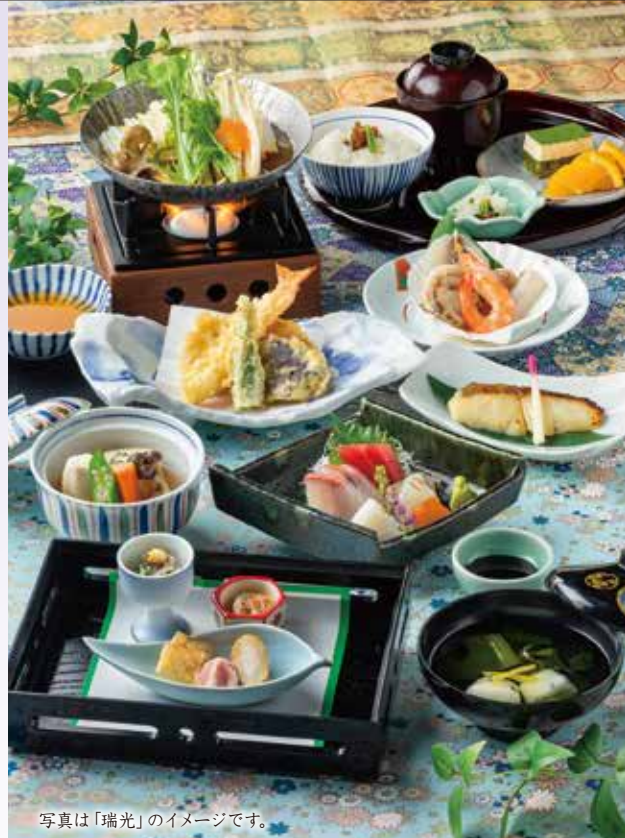
写真は「瑞光」のイメージです。