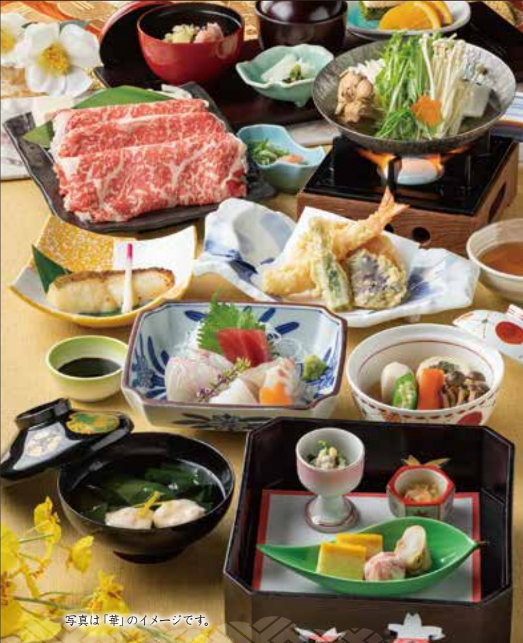
写真は「華」のイメージです。