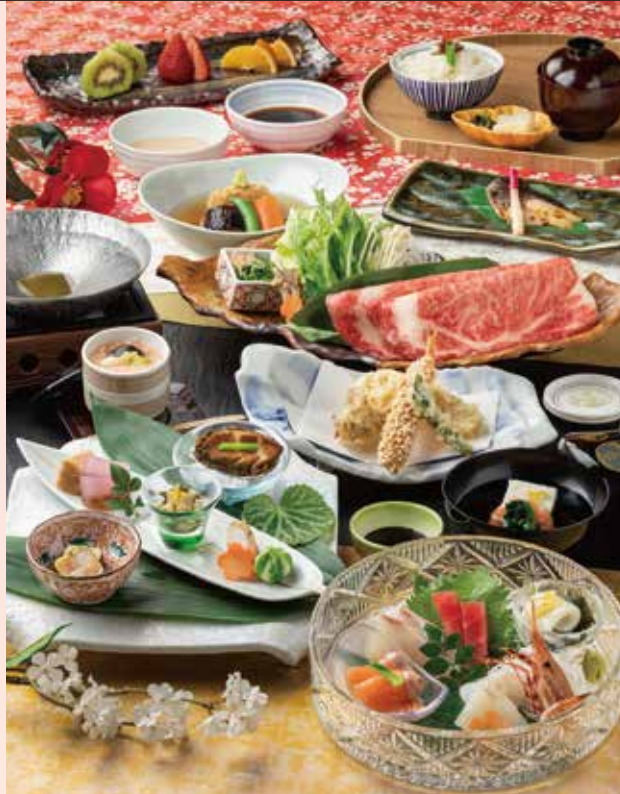
写真は「扇」のイメージです。

扇 おうぎ ◆特別前菜 ◆前椀 ◆お造り6種 ◆上焼物 ◆上煮物 ◆上揚物 ◆上茶碗蒸し ◆飛騨牛小鍋 ◆食事 ◆デザート3種 9,500円(税込10,450円)