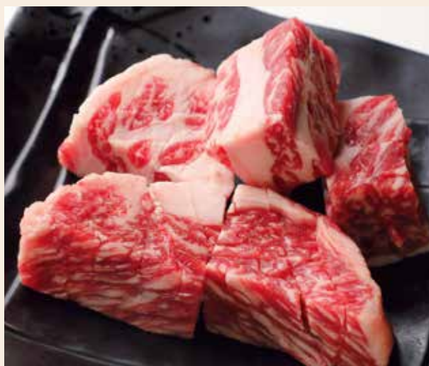
和牛サイコロステーキ