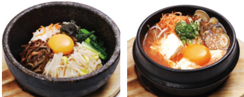
石焼ビビンバセット スンドゥブセット