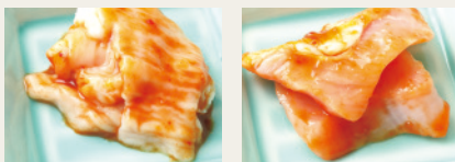
テッチャン(国産牛) とろミノ(国産牛) 各 290円 (税込319円)