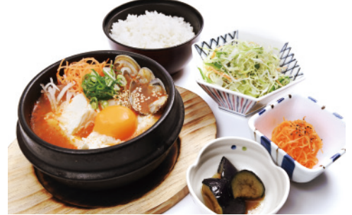
スンドゥブセット 990円 (税込1,089円) サラダ・小鉢(2種)・ごはん付