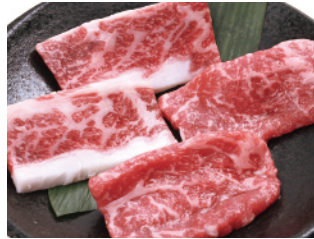
カルビ・サーロイン