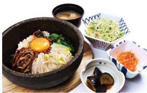
石焼ビビンバセット 990円 (税込1,089円) サラダ・小鉢(2種)・味噌汁付