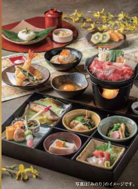
写真は「みのり」のイメージです。