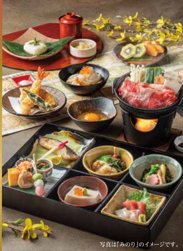
写真は「みのり」のイメージです。