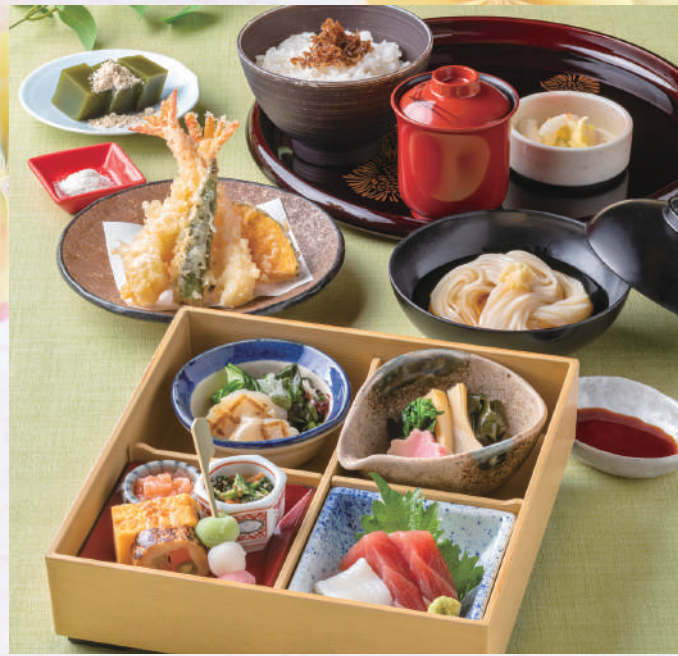
会席なごみ 税込3,300円

松花堂〈八寸・胡麻豆腐・刺身盛合せ・酢の物・煮物・焼物〉・上揚物・上麵碗・小鍋〈すき焼きまたは季節の海鮮鍋〉・お食事・果物