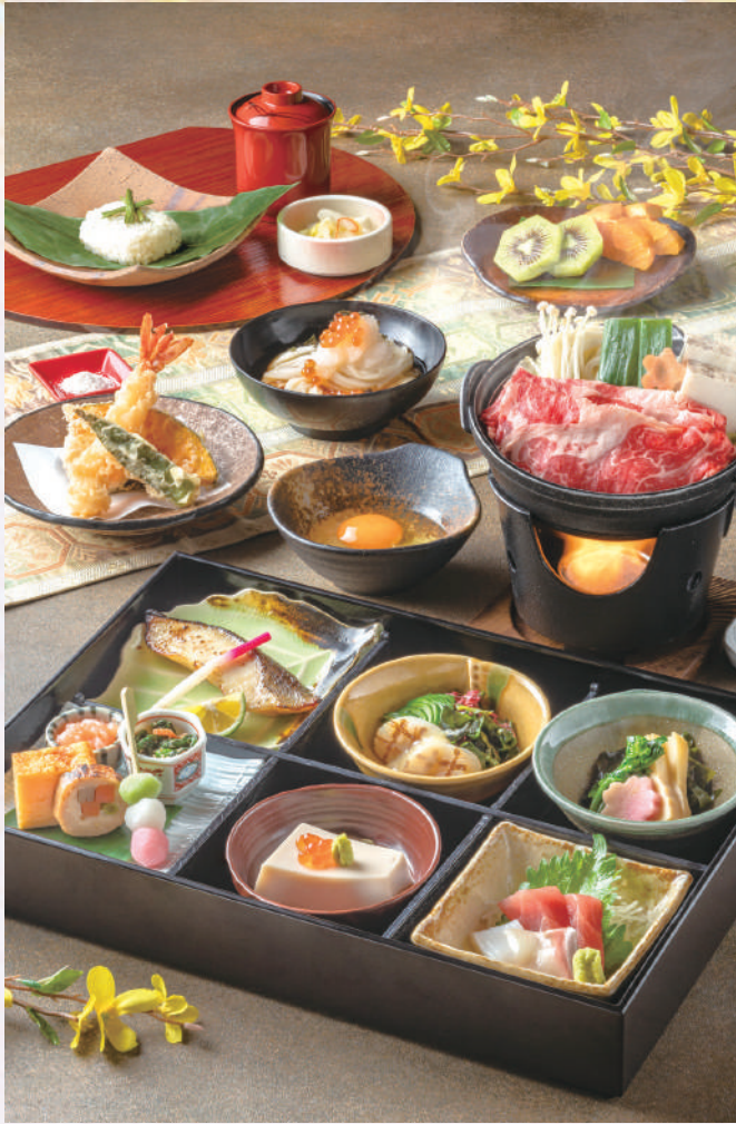
上会席みのり 税込5,800円

松花堂〈八寸・胡麻豆腐・刺身盛合せ・酢の物・煮物・焼物〉・上揚物・上麵碗・小鍋〈すき焼きまたは季節の海鮮鍋〉・お食事・果物