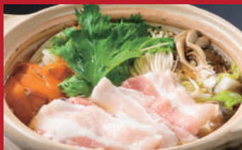
豚バラしゃぶしゃぶ鍋