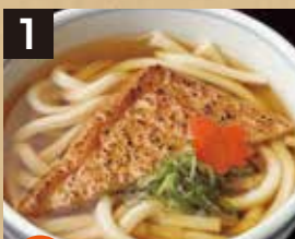
1 温 きつねうどん