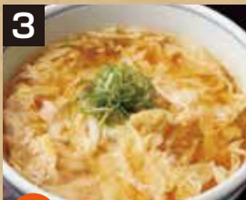
3 温 玉子とじうどん