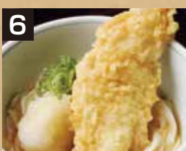
6 冷 鶏天うどん