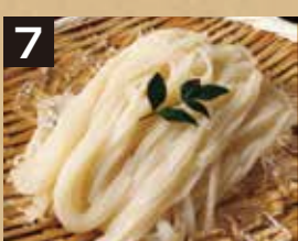
7 冷 ざるうどん(細うどん)