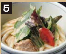
5 冷 サラダうどん