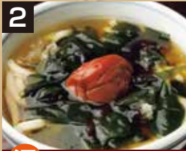
2 温 梅わかめうどん