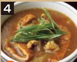
4 温 カレーうどん