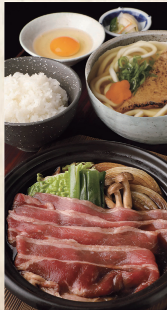
牛すき焼き定食 きつねうどん またはざるうどん 1,700円 税込1,870円