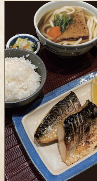
鯖の塩焼き定食 きつねうどん またはざるうどん 1,320円 税込1,452円