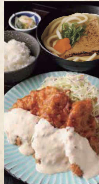
チキン南蛮定食 きつねうどん またはざるうどん 1,350円 税込1,485円