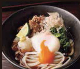
冷 牛肉ぶっかけうどん 鹿野うどん(鴨うどん)使用