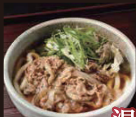
温 牛肉なんばうどん