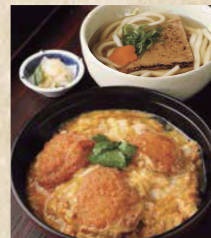
豚ひれかつ丼定食 きつねうどん またはざるうどん 1,350円 税込1,485円