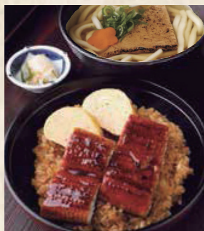
鰻玉丼定食 きつねうどん またはざるうどん 1,800円 税込1,980円