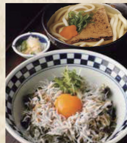
釜揚げしらす丼定食 きつねうどん またはざるうどん 1,350円 税込1,485円