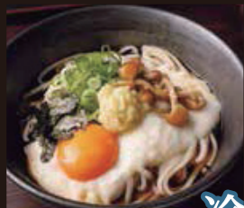
冷 とろろなめこぶっかけうどん