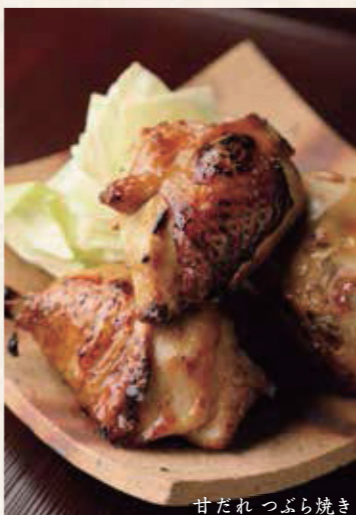
甘だれ つぶら焼き

1個 税込270円 3個 税込780円 5個 税込1,250円 税込1,375円