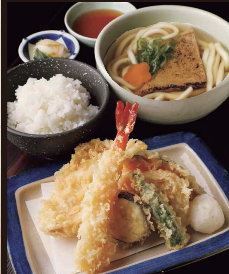
天ぷら定食 名物鶏天入り きつねうどんまたはざるうどん 1,350円 税込1,485円