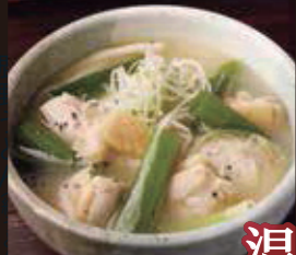
温 鶏と葱の鶏塩うどん