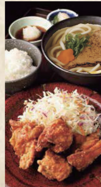
鶏唐揚げ定食 特製おろしポン酢でさっぱりと きつねうどん またはざるうどん 1,250円 税込1,375円