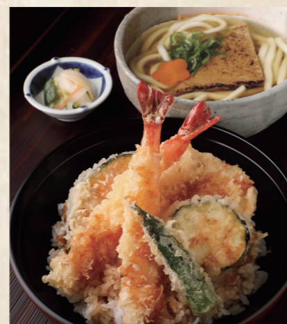
大海老天丼定食 きつねうどん またはざるうどん 1,500円 税込1,650円