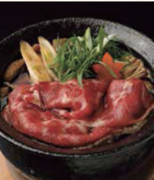
牛すき焼きうどん 1,650円 税込1,815円