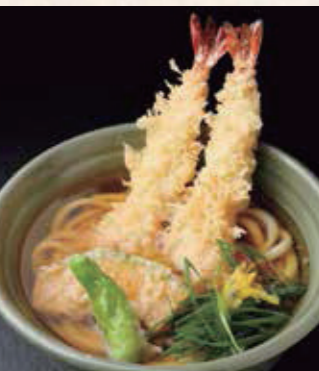
大海老 天ぷらうどん 1,350円 税込1,485円