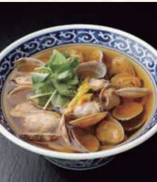
あさりの 貝汁うどん 1,050円 税込1,155円