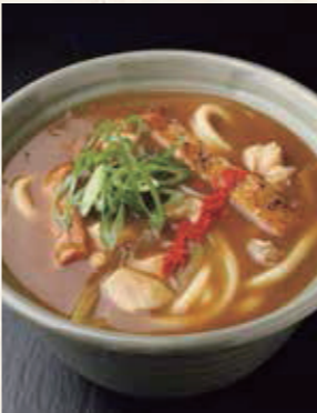
かしの 濃厚カレー うどん 1,050円 税込1,155円