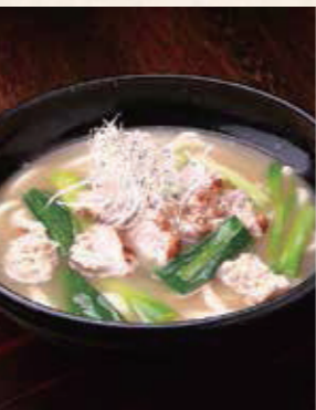
鶏と葱の 鶏塩うどん 1,000円 税込1,100円