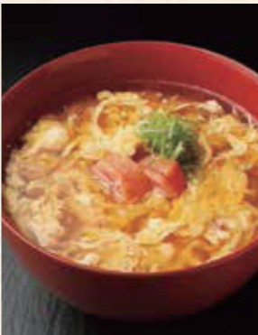
ふわふわ 玉子と明太子の あんかけうどん 1,050円 税込1,155円