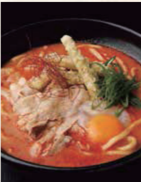
牛蒡天と豚ばらの 辛味噌うどん 1,300円 税込1,430円