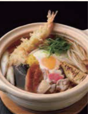
ふうふや名物 銅焼きうどん 1,450円 税込1,595円