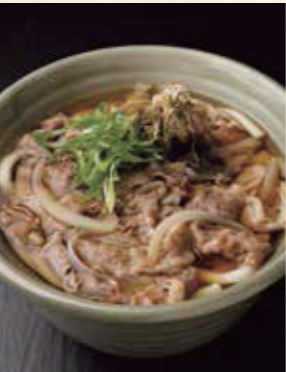
名物 牛肉なんぼうどん 1,150円 税込1,265円