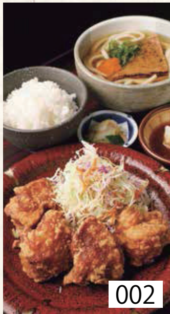
002 鶏唐揚げ定食 ごはん・香の物付 左記選べる うどんより一品 1,050円 税込1,155円 おろしポン酢でお召し上がりいただきます