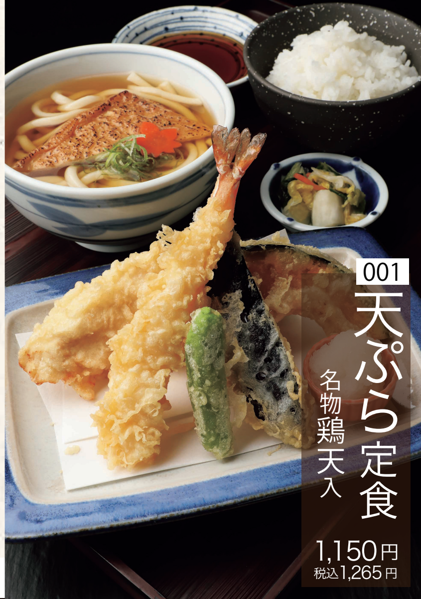
001 天ぷら定食 名物鶏天入 1,150円 税込1,265円