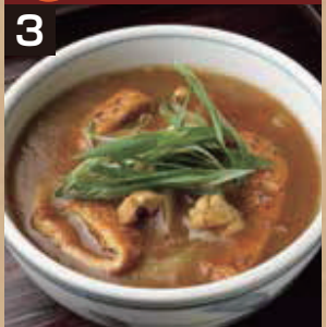
3 温 カレーうどん