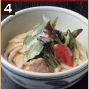
4 冷 サラダうどん