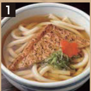
1 温 きつねうどん