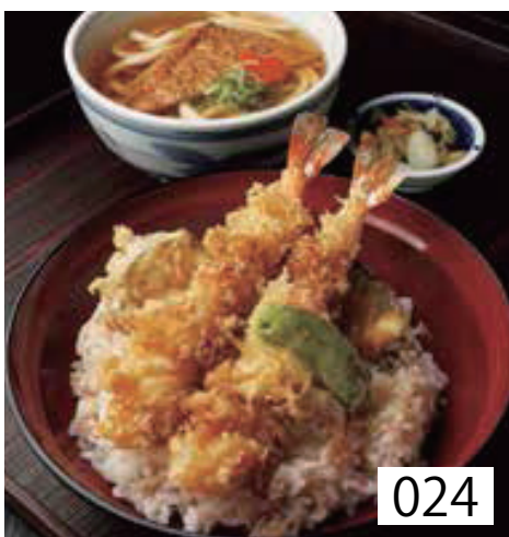
024 大海老天丼 香の物付 左記選べる うどんより一品 1,400円 税込1,540円