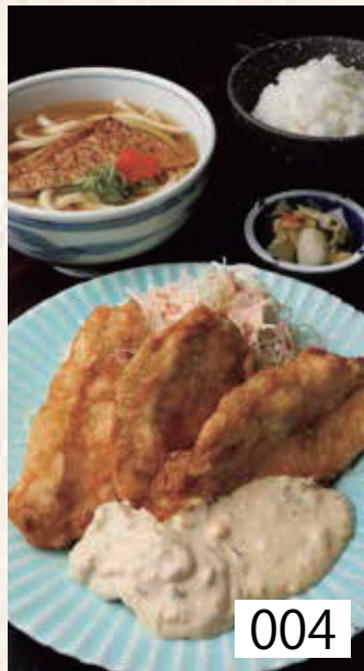
004 チキン南蛮定食 ごはん・香の物付 左記選べる うどんより一品 1,150円 税込1,265円