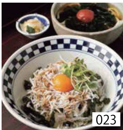
023 しらす丼定食 香の物付 左記選べる うどんより一品 1,150円 税込1,265円