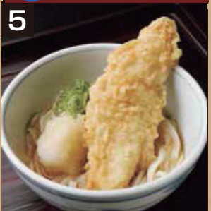
5 冷 鶏天うどん