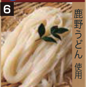
6 冷 ざるうどん (細うどん) 鹿野うどん使用