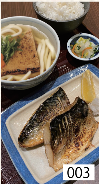
003 鯖の塩焼き定食 ごはん・香の物付 左記選べる うどんより一品 1,120円 税込1,232円