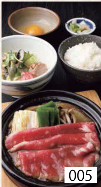
005 牛すき焼き定食 ごはん・香の物付 左記選べる うどんより一品 1,500円 税込1,650円