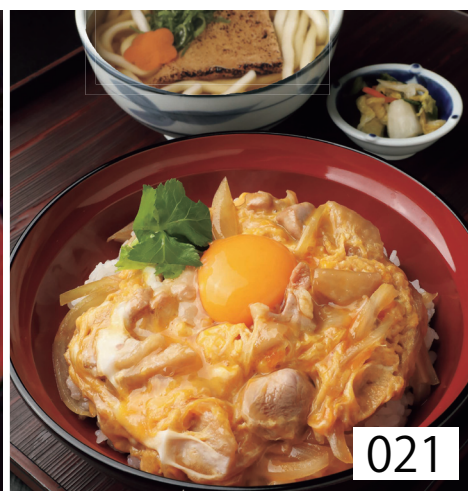
021 親子丼定食 香の物付 左記選べる うどんより一品 1,180円 税込1,298円