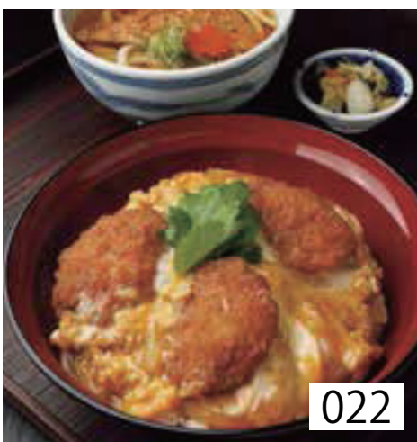
022 豚ひれかつ丼 香の物付 左記選べる うどんより一品 1,150円 税込1,265円