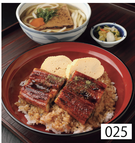
025 鰻玉丼定食 香の物付 左記選べる うどんより一品 1,600円 税込1,760円