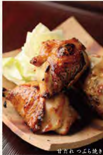
甘だれ つぶら焼き