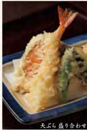
天ぷら盛り合わせ