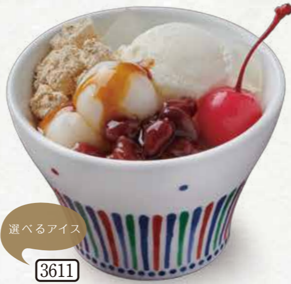
選べるアイス 3611 白玉クリームあんみつセット (抹茶/北海道ミルク) 450円(税込495円)