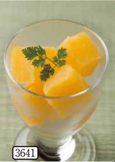
3641 清見果汁使用 オレンジ ジュレシャーベット 255円(税込280円)