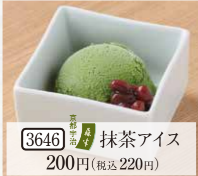
3646 京都宇治 抹茶 アイスクリーム 200円(税込220円)