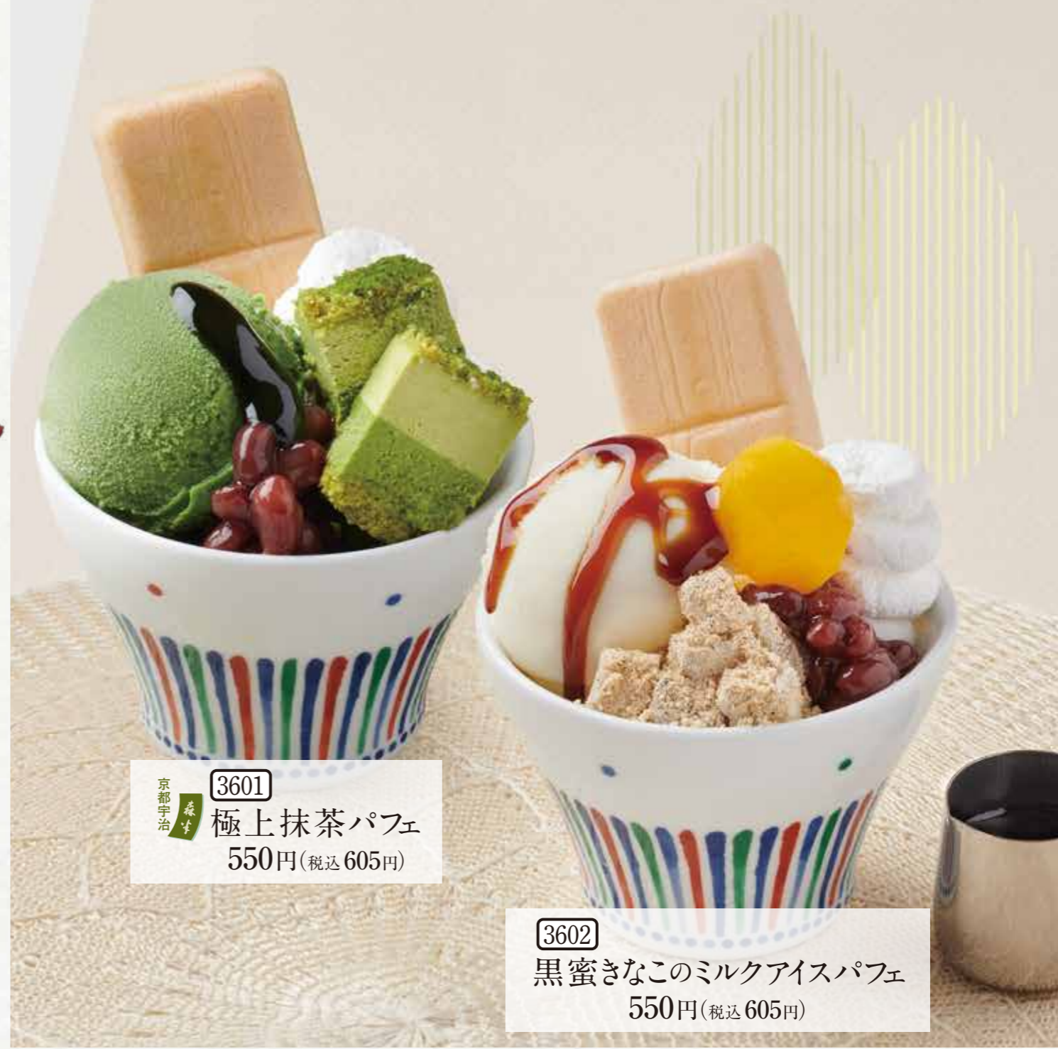
3601 京都宇治 抹茶 極上抹茶パフェ 550円(税込605円)