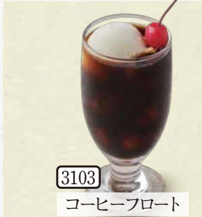
3103 コーヒーフロート