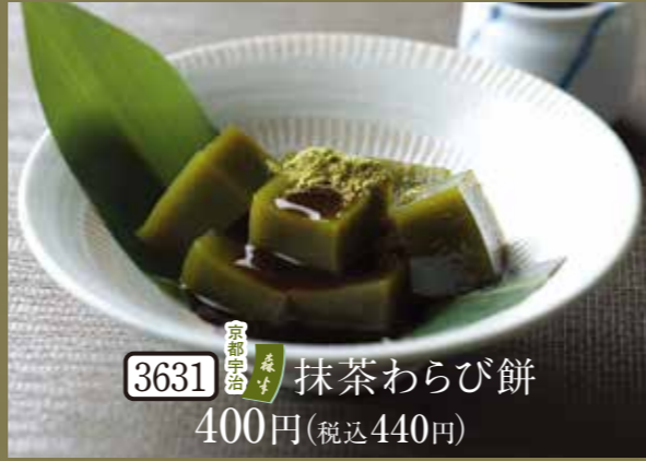
3631 京都宇治 抹茶 わらび餅 400円(税込440円)