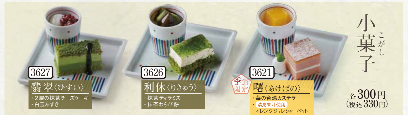
3627 翡翠(ひすい) ・2層の抹茶チーズケーキ ・白玉あずき