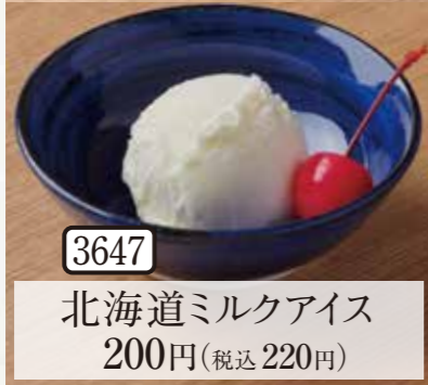
3647 北海道ミルクアイス 200円(税込220円)