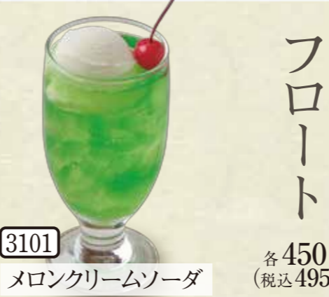
3101 メロンクリームソーダ