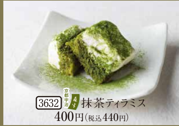
3632 京都宇治 抹茶 ティラミス 400円(税込440円)

アレルギー情報はこちら メニューの アレルギー特定原材料8品目については 上記のQRコードからご確認ください。