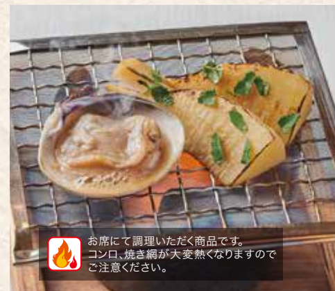
1101 蛤と筍の焦がし醤油焼き 600円 (税込660円)