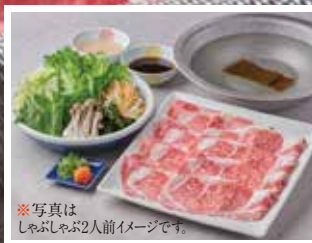
*写真はしゃぶしゃぶ2人前イメージです。

「お肉」はよく加熱してお召し上がりください。 お席にて調理いただく商品です。 コンロ、鍋が大変熱くなりますのでご注意ください。