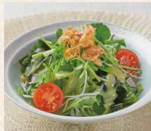
1102 セリと桜海老のミニサラダ ～辛子酢味噌ドレッシング～ 450円 (税込495円)