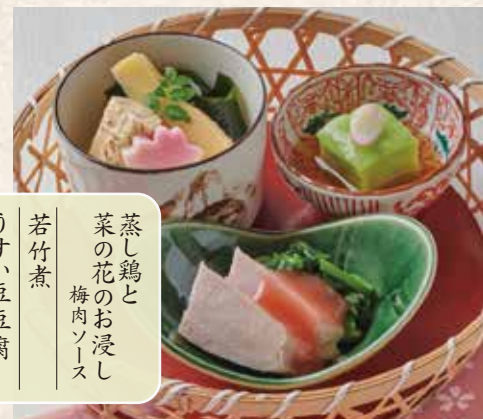
1103 季節の籠盛り3種 700円 (税込770円)