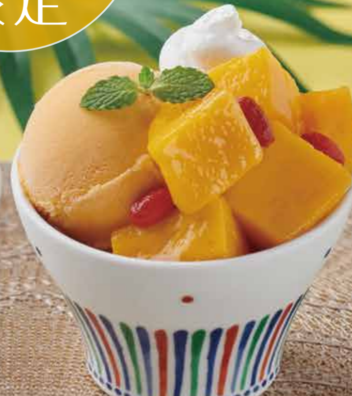
ごろっとマンゴーパフェ 650円(税込715円)