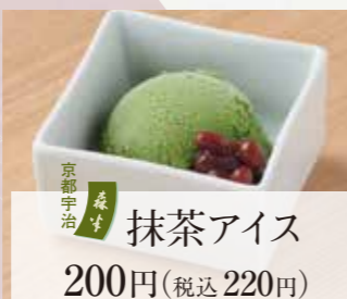
抹茶アイス 200円(税込220円)