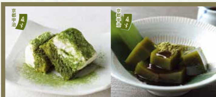
抹茶ティラミス 400円(税込440円)