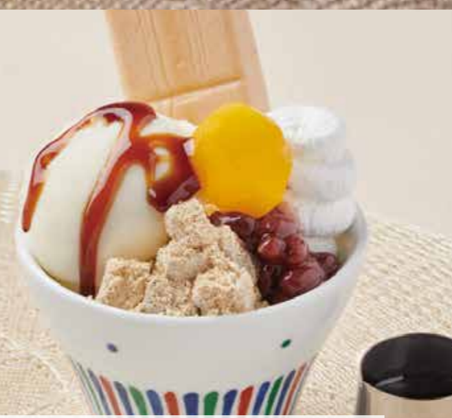
黒蜜きなこのミルクアイスパフェ 550円(税込605円)