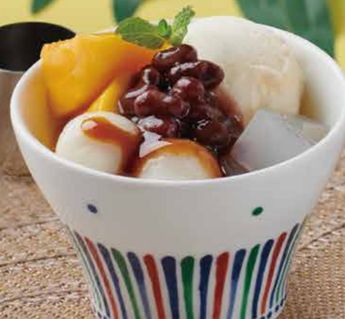
マンゴー白玉クリームあんみつ 450円(税込495円)