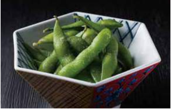
1201 枝豆 300円 (税込330円)