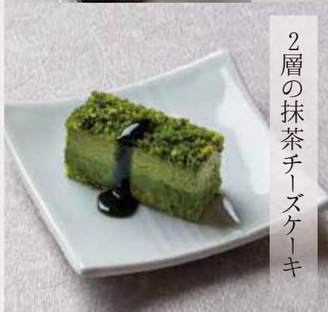
2層の抹茶チーズケーキ