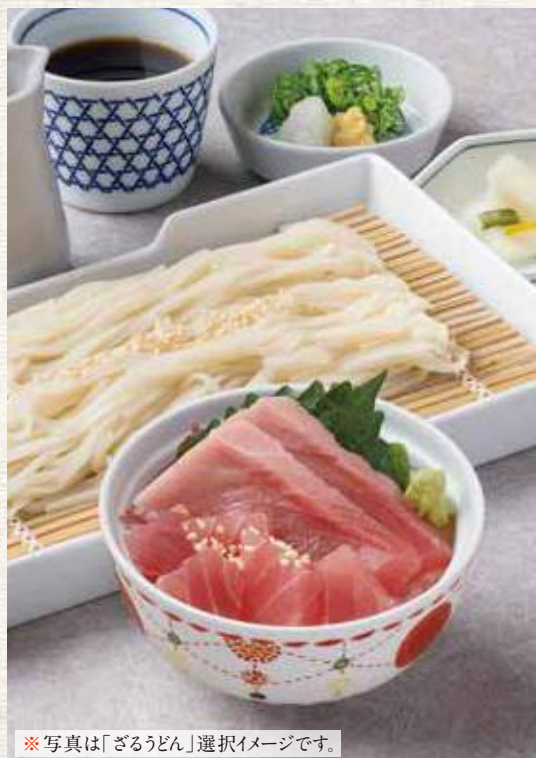
※写真は「ざるうどん」選択イメージです。