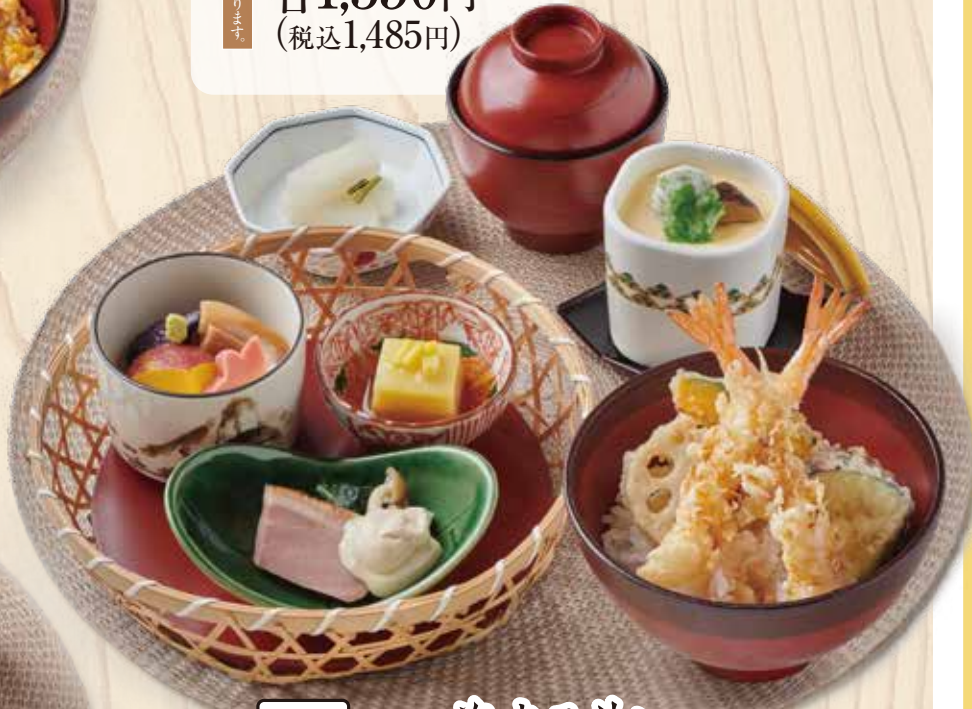
602 小ぶり海老天丼と 季節の籠盛り3種セット