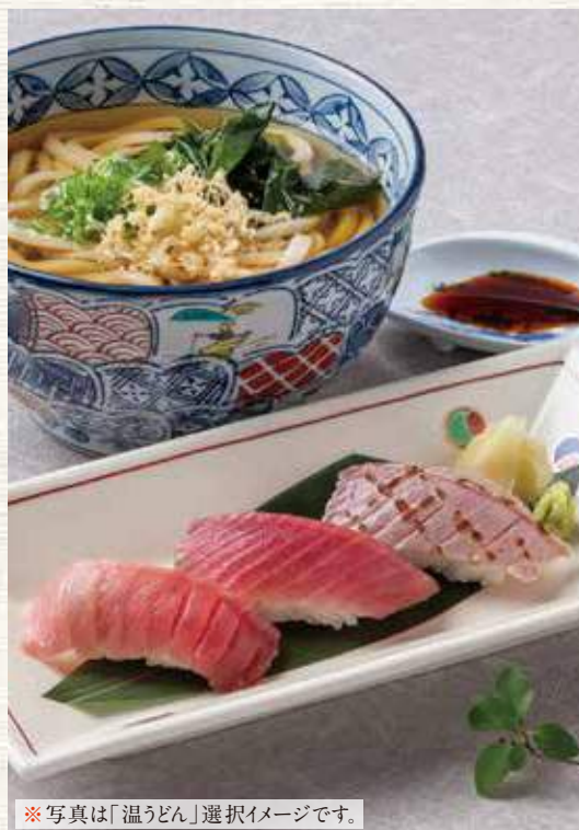
※写真は「温うどん」選択イメージです。