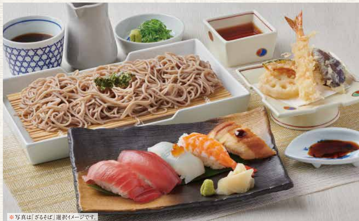
※写真は「ざるそば」選択イメージです。

ざるそば／ざるうどん 温そば／温うどん からお選びいただけます。 麺はそばと同じ釜で茹でております。