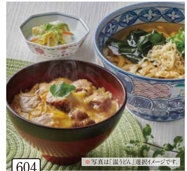
604 小ぶり炙り鶏の親子丼と 選べる麺セット 1,200円(税込1,320円)