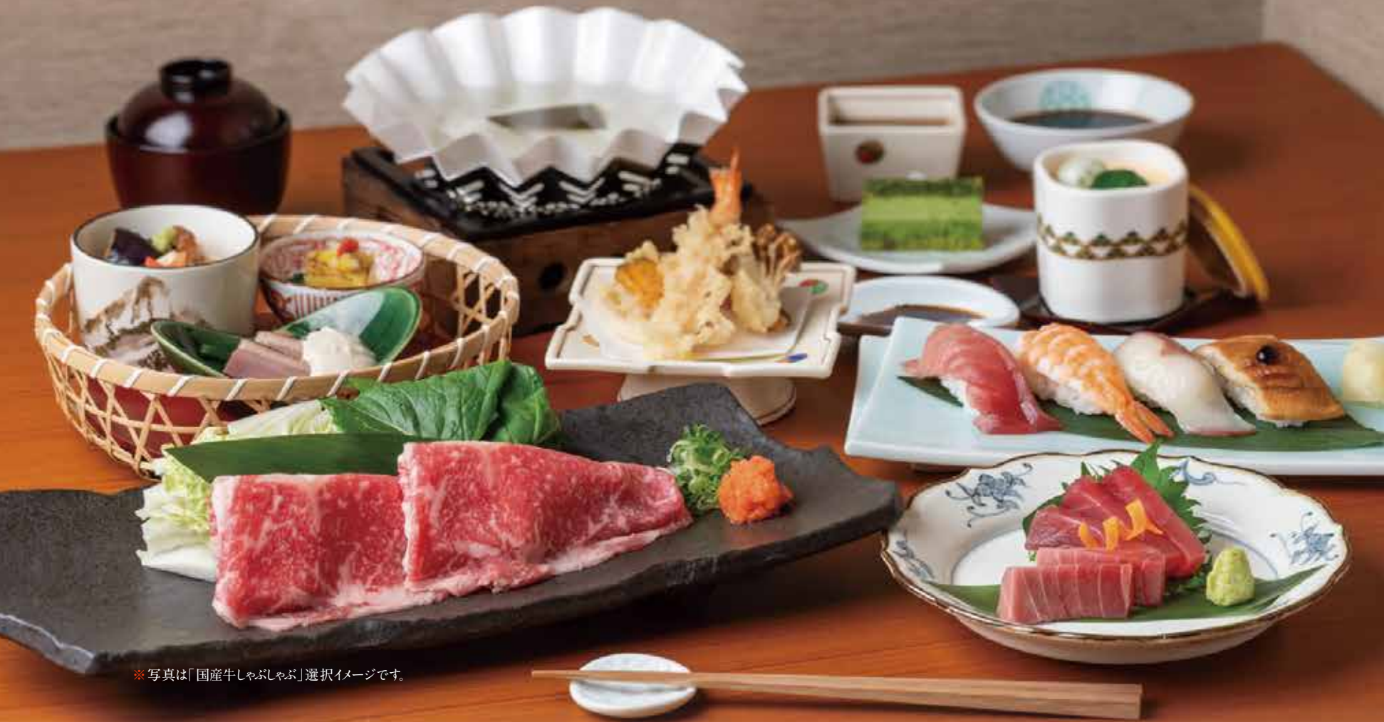
※写真は「国産牛しゃぶしゃぶ」選択イメージです。