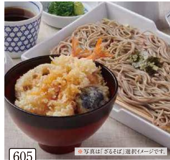
605 小ぶり海老天丼と 選べる麺セット 1,200円(税込1,320円)