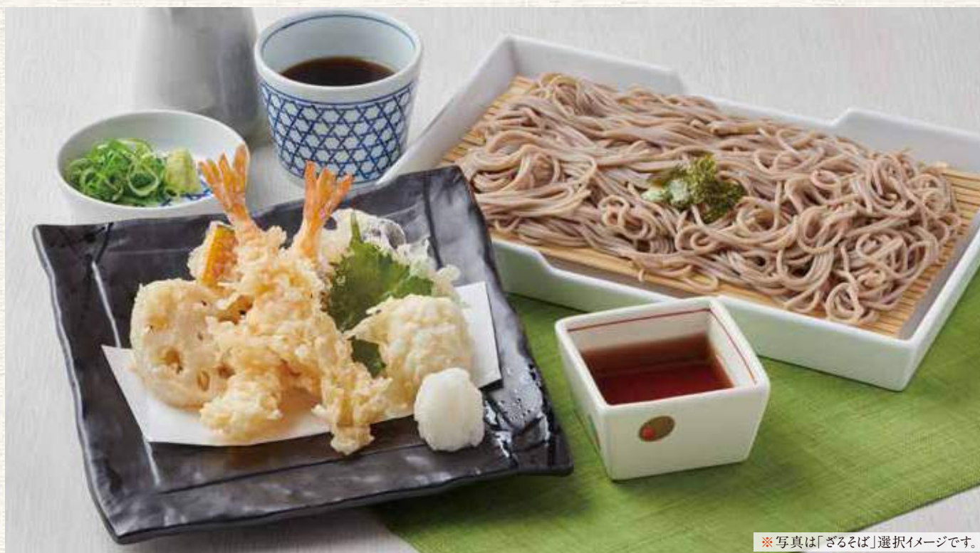
※写真は「ざるそば」選択イメージです。