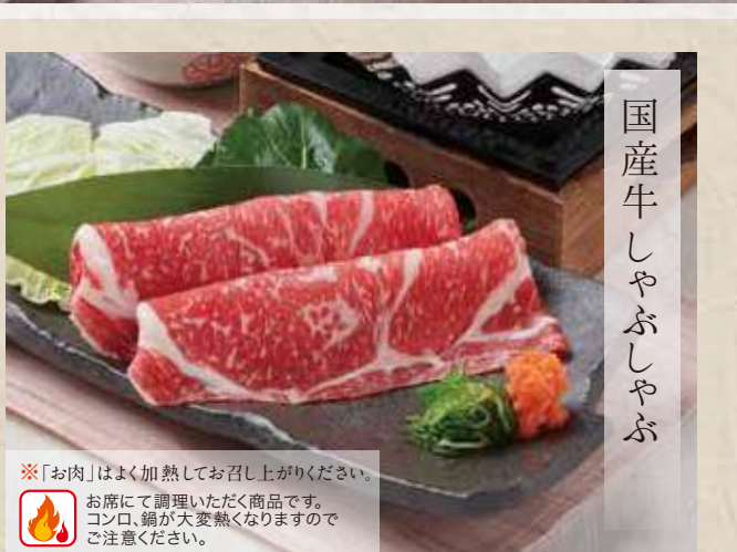
国産牛しゃぶしゃぶ