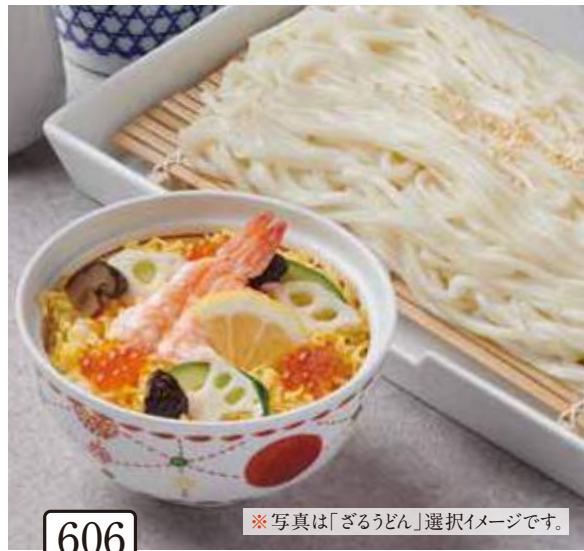
606 彩りちらし寿司と 選べる麺セット 1,200円(税込1,320円)

ざるそば／ざるうどん／温そば／温うどんからお選びいただけます。 麺はそばと同じ釜で茹でております。