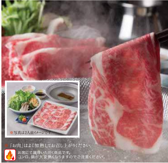
※写真は2人前イメージです。

※「お肉」はよく加熱してお召し上がりください。 お席にて調理いただく商品です。 コンロ、鍋が大変熱くなりますのでご注意ください。