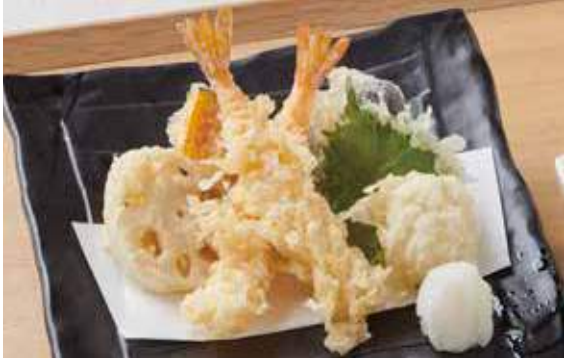
1351 海老天ぷら盛合せ 800円 (税込880円)