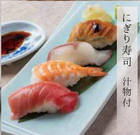
にぎり寿司 汁物付