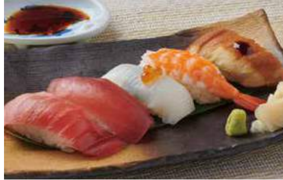
1501 にぎり寿司5貫 1,100円 (税込1,210円)