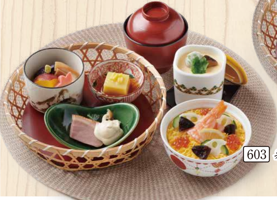
603 彩りちらし寿司と 季節の籠盛り3種セット