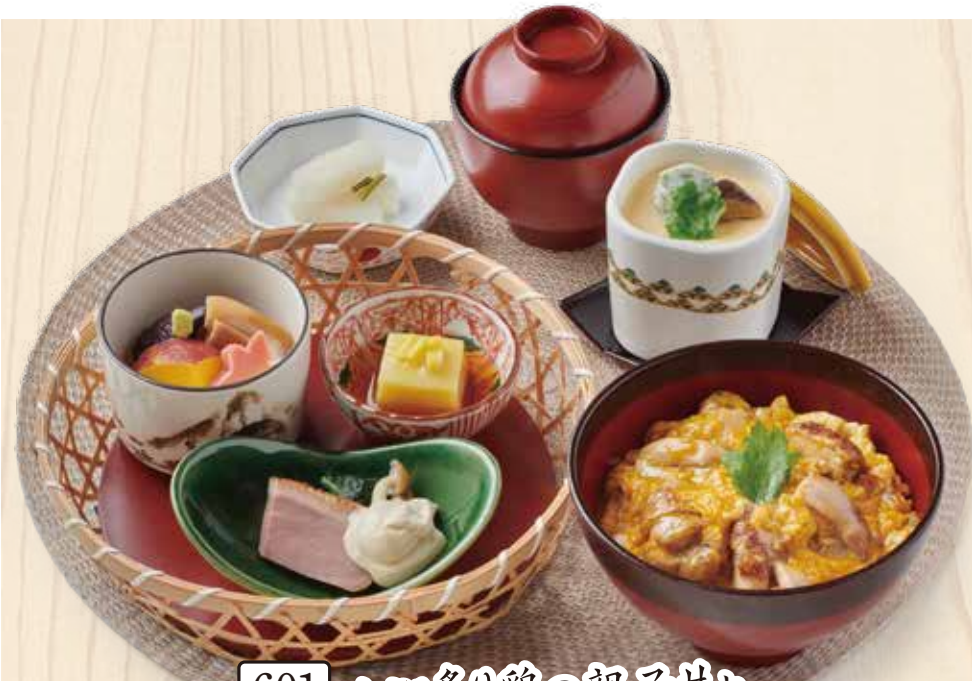
601 小ぶり炙り鶏の親子丼と 季節の籠盛り3種セット