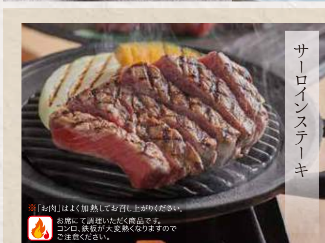
サーロインステーキ