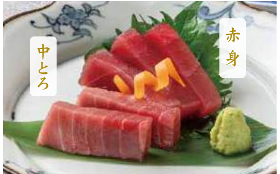
1301 2種のまぐろお造り 900円 (税込990円)