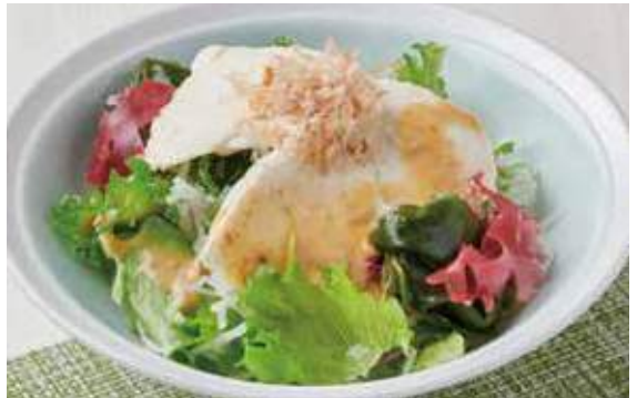
1211 豆腐と海藻のミニサラダ ~焙煎胡麻ドレッシング~ 400円 (税込440円)