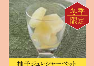
柚子ジュレシャーベット