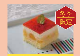
林檎のシブースト