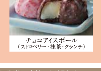
チョコアイスボール (ストロベリー・抹茶・クランチ)