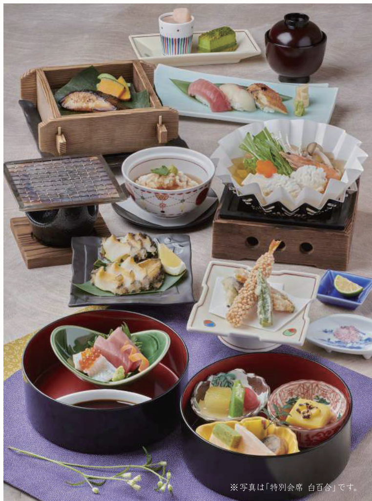
※写真は「特別会席 白百合」です。