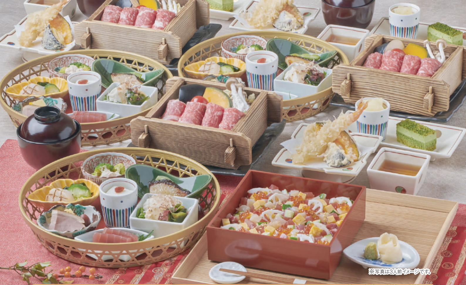
※写真は3人前イメージです。