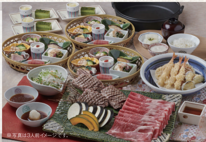
※写真は3人前イメージです。