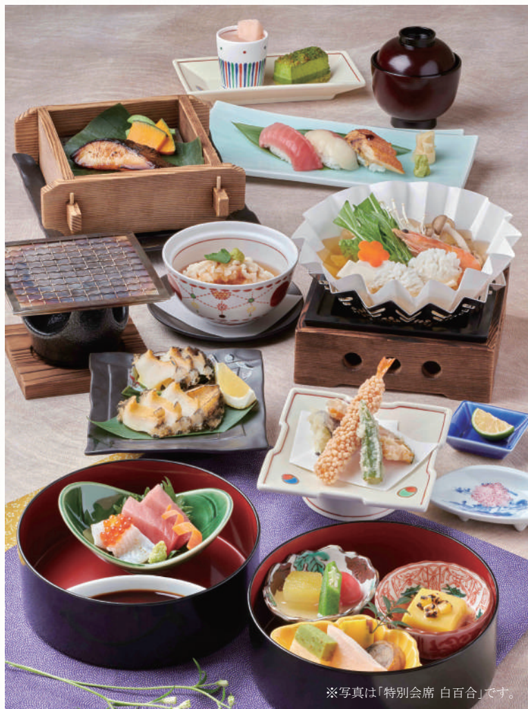
※写真は「特別会席 白百合」です。