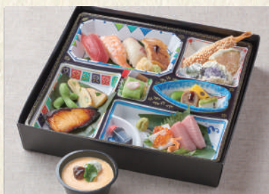
※写真はすべてイメージです。