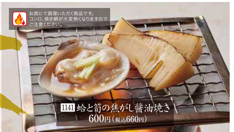
1141 蛤と筍の焦がし醤油焼き 600円(税込660円)