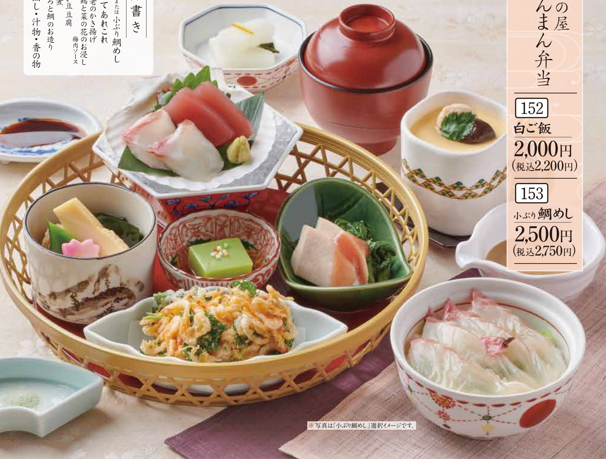
※写真は「小ぶり鯛めし」選択イメージです。

お品書き 白ご飯または小ぶり鯛めし 籠仕立てあれこれ 桜海老のかき揚げ 蒸し鶏と菜の花のお浸し 梅肉ソース うすい豆腐 若竹煮 まぐろと鯛のお造り 茶碗蒸し・汁物・香の物