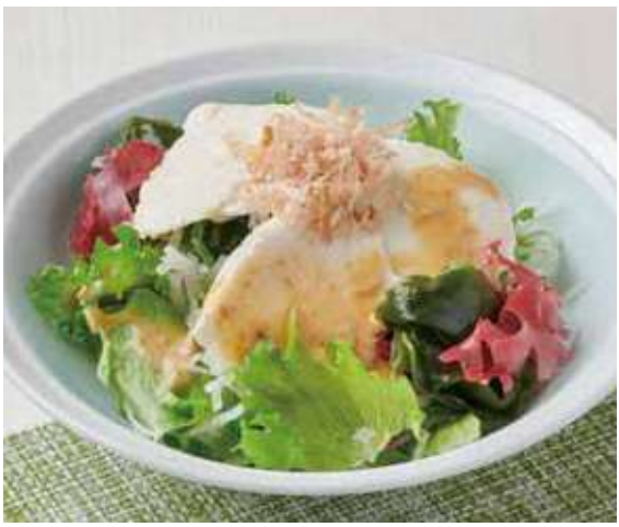
1211 豆腐と海藻のミニサラダ ～焙煎胡麻ドレッシング～ 400円(税込440円)