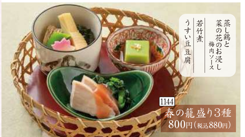
1144 春の籠盛り3種 800円(税込880円) 蒸し鶏と菜の花のお浸し 梅肉ソース 若竹煮 うすい豆腐