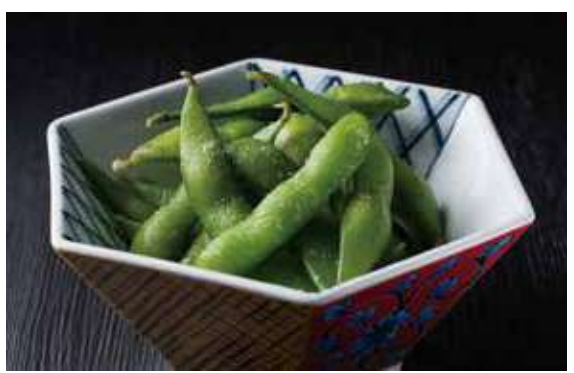
1201 枝豆 300円(税込330円)