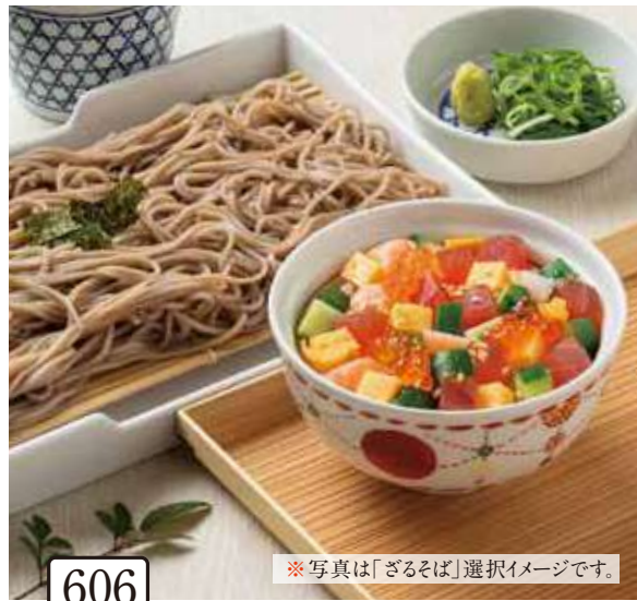
606 海鮮ばらちらし寿司と 選べる麺セット 1,500円 (税込1,650円)

ざるそば／ざるうどん／温うどんからお選びいただけます。 麺はそばと同じ釜で茹でております。