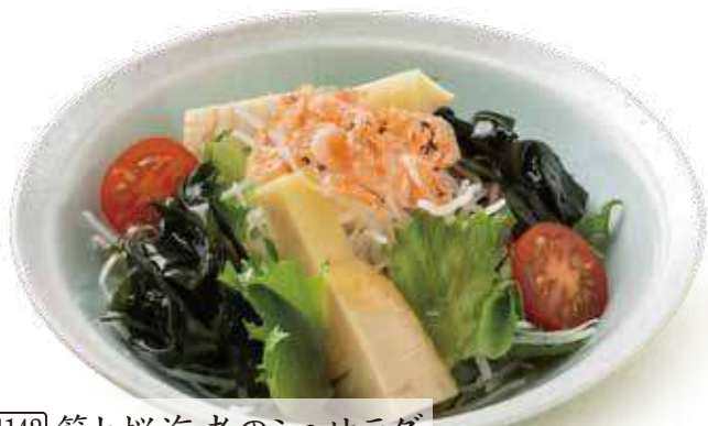
1142 筍と桜海老のミニサラダ ~ゆず醤油ドレッシング~ 450円(税込495円)