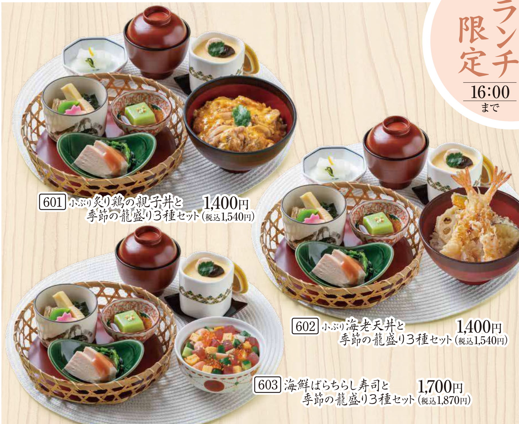
601 小ぶり炙り鶏の親子丼と 季節の籠盛り3種セット (税込1,540円) 1,400円