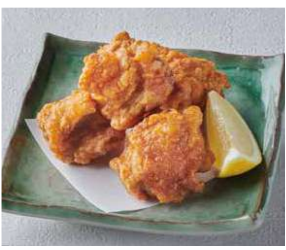
1356 若鶏のから揚げ 600円(税込660円)