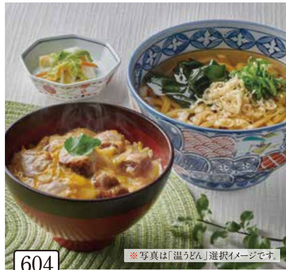
604 小ぶり炙り鶏の親子丼と 選べる麺セット 1,200円 (税込1,320円)