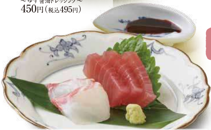
1143 鯛とまぐろのお造り 1,000円(税込1,100円) 1302 まぐろのお造り 800円(税込880円)