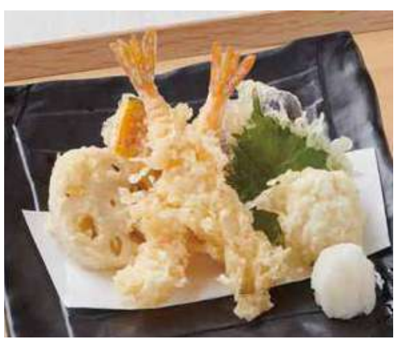
1351 海老天ぷら盛合せ 800円(税込880円)