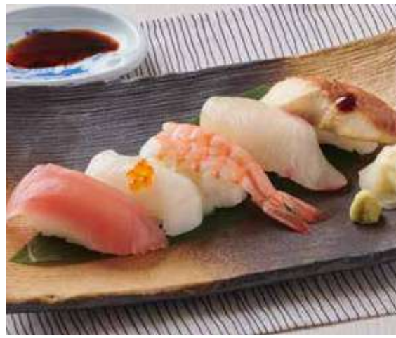
1501 にぎり寿司5貫 1,100円(税込1,210円)