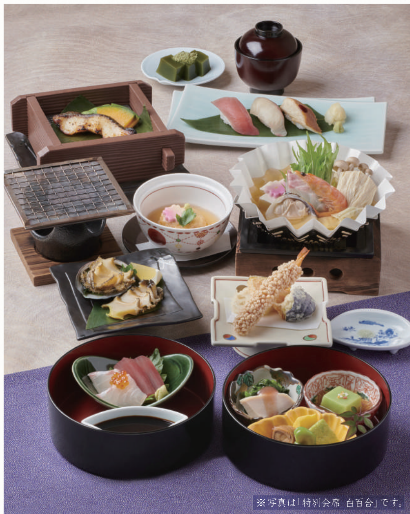
※写真は「特別会席 白百合」です。