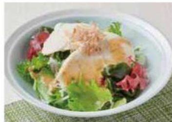
1211 豆腐と海藻のミニサラダ 400円(税込440円)