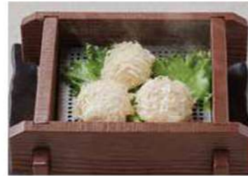
1226 いかしゅうまい 800円(税込880円)