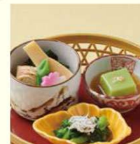
1144 春の籠盛り3種 800円(税込880円)