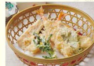
1146 春の天ぷら盛合せ 1,000円(税込1,100円)