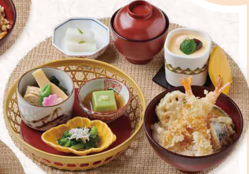
602 小ぶり海老天丼と 季節の籠盛り3種セット 1,400円 (税込1,540円)