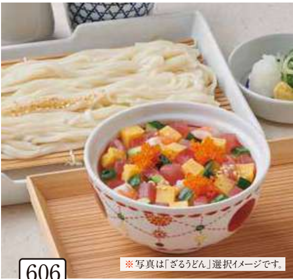
606 海鮮ばらちらし寿司と 選べる麵セット 1,500円 (税込1,650円) ※写真は「ざるうどん」選択イメージです。