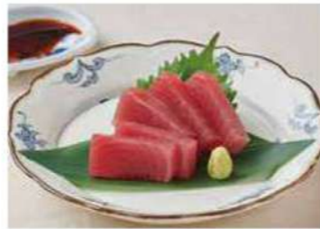
1302 まぐろのお造り 800円(税込880円)