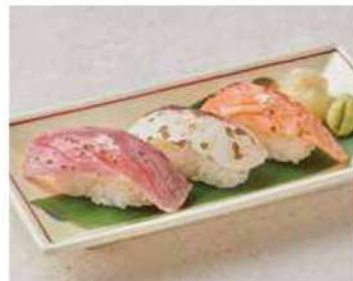
1504 炙り柚子塩3貫 600円(税込660円)