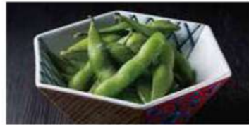
1201 枝豆 300円(税込330円)