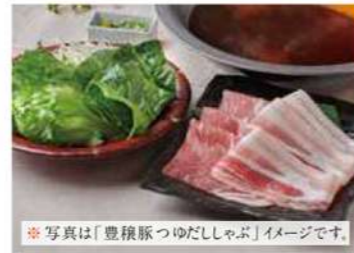
1008 豊稜豚つゆだししゃぶ 1,800円(税込1,980円)