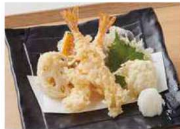
1351 海老天ぷら盛合せ 800円(税込880円)