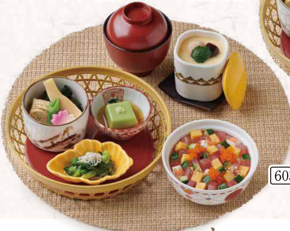
603 海鮮ばらちらし寿司と 季節の籠盛り3種セット 1,700円 (税込1,870円)