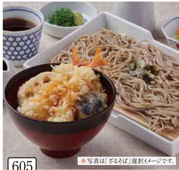
605 小ぶり海老天丼と 選べる麵セット 1,200円 (税込1,320円) ※写真は「ざるそば」選択イメージです。