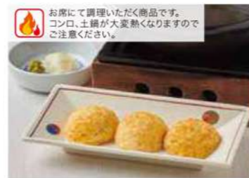
1227 明石焼き 600円(税込660円)