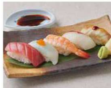
1501 にぎり寿司5貫 1,100円(税込1,210円)