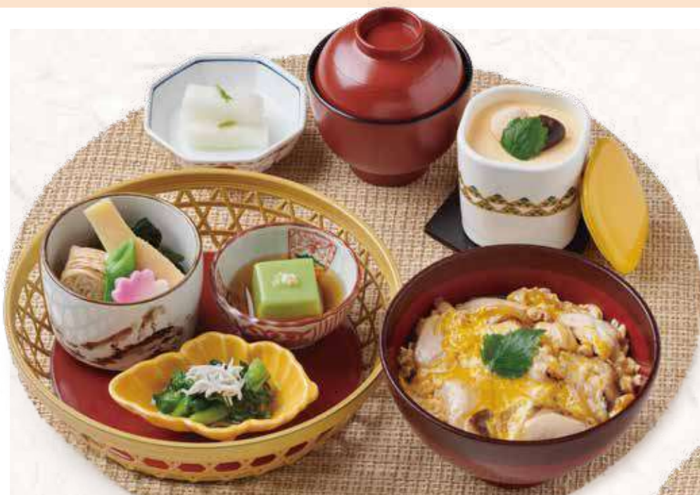
601 小ぶり炙り鶏の親子丼と 季節の籠盛り3種セット 1,400円 (税込1,540円)