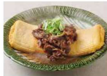
1221 すき焼きだし巻き 900円(税込990円)