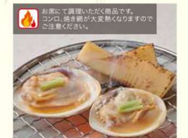
1141 蛤と筍の焦がし醤油焼き 600円(税込660円)