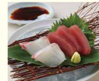
1143 まぐろと鯛のお造り 1,000円(税込1,100円)