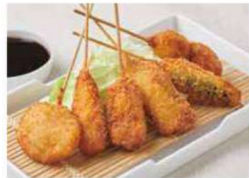
1361 串揚げ6種盛合せ 900円(税込990円)