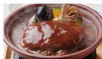
1371 煮込みハンバーグ 1,600円(税込1,760円)

お席にて調理いただく商品です。コンロ、鍋、陶板が大変熱くなりますのでご注意ください。