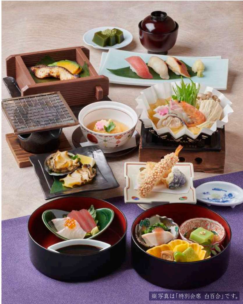
※写真は「特別会席 白百合」です。