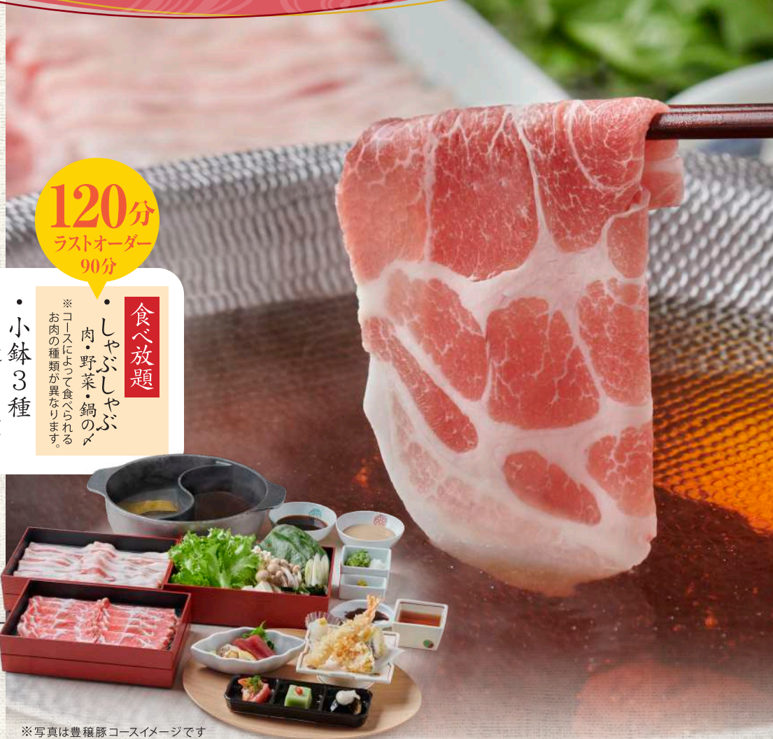
※写真は豊穰豚コースイメージです